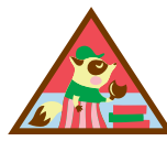
Tomadora de decisiones sobre galletas