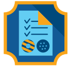
Influencer de galletas