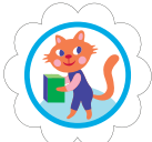
Fijadora de metas de galletas