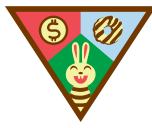
Mis clientes de galletas