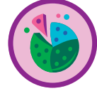
Colaboradora de galletas