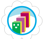
Mi primer negocio de galletas

*Por el momento, sólo las insignias Brownie y Daisy están disponibles en formato bilingüe.