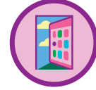
Mi equipo galletero