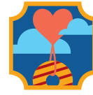
Mi currículum de negocio de galletas